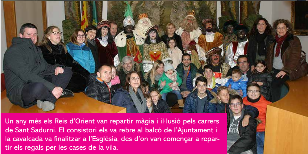
Un any més els Reis d'Orient van repartir màgia i il·lusió pels carrers de Sant Sadurni. El consistori els va rebre al balcó de l'Ajuntament i la cavalcada va finalitzar a l'Església, des d'on van començar a repartir els regals per les cases de la vila.