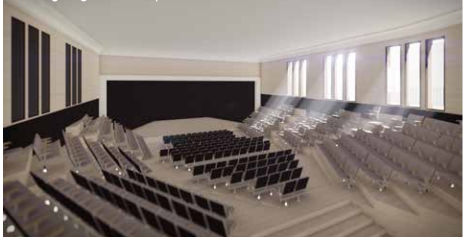
Muntatge digital de com podria ser el futur interior de la sala de El Centre

L'entitat confia en fer realitat el somni a mig termini i ja es marca alguns objectius per aquest 2017. "Aquest any esperem tenir el projecte enllestit i els primers acords d'esponsorització i ajuts públics i privats acordats".