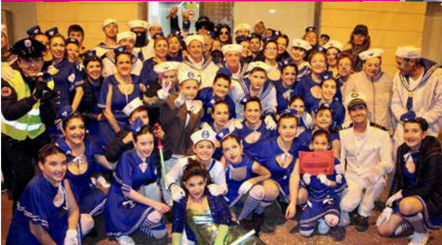
La comparsa "Alta mar" del Barri Vilarnau es va endur el primer premi a la Rua de Carnaval que va comptar amb set grups i més de 320 participants. Els Trolls del barri Sant Llorenç i els Mussols de l'AMPA La Pau van obtenir el segon i tercer lloc al concurs de disfresses.